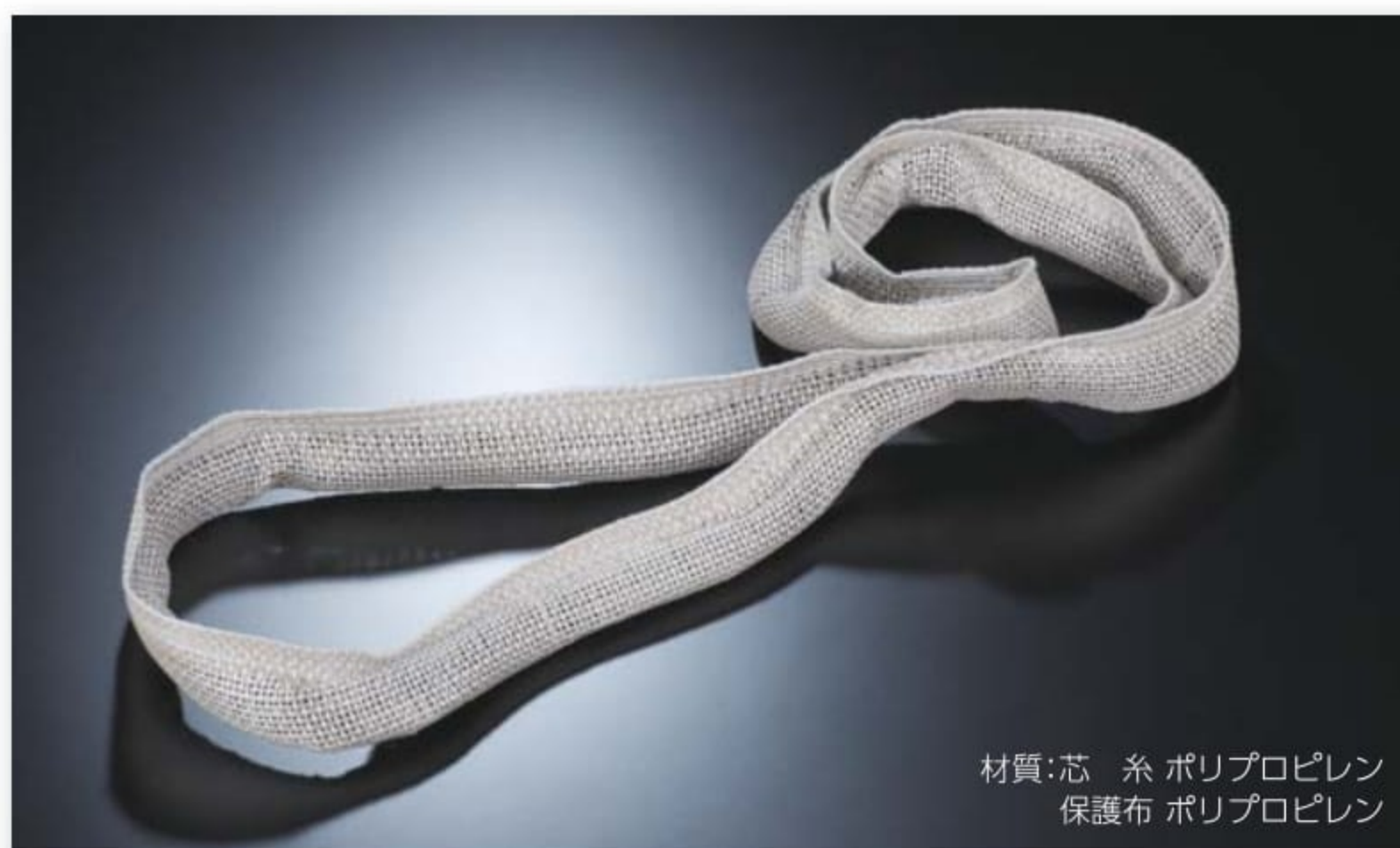
材質:芯糸 ポリプロピレン 保護布 ポリプロピレン