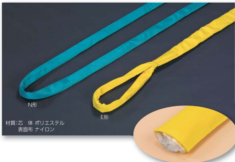
材質:芯 体 ポリエステル 表面布 ナイロン