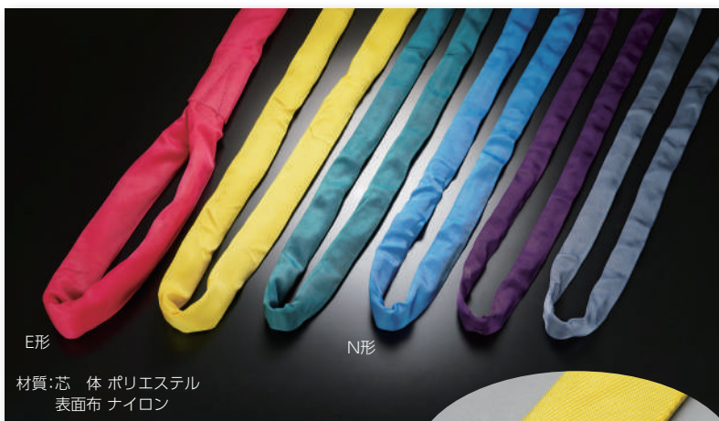
E形 N形 材質: 芯 体 ポリエステル 表面布 ナイロン